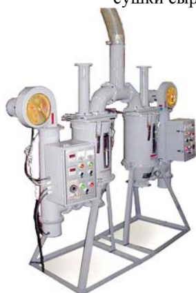
Регенерационная система осушения воздуха

Для повышения качества сушки сырья ПЭТ используется система осушения воздуха с регенерацией. Достижимая точка росы: -40 °С.