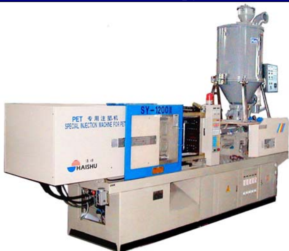
Инжекционно-литьевая машина SY1200 с бункером сушки сырья ПЭТ