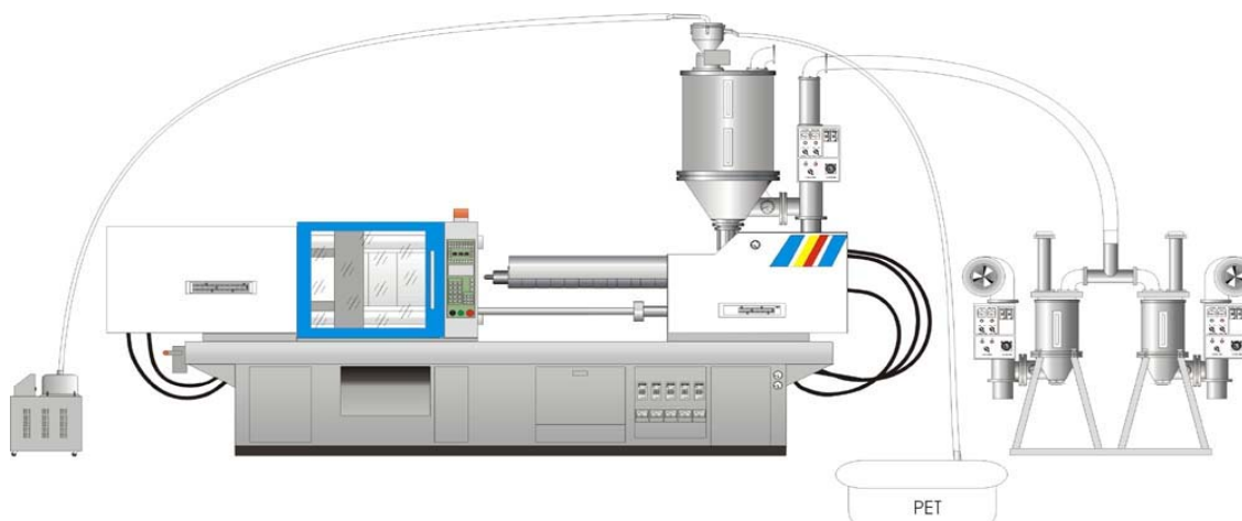
Схема подключения комплекса оборудования для производства преформ ПЭТ